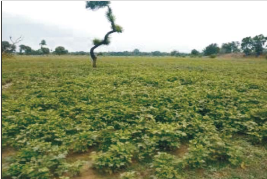
Crop in Dhab land

बूढ़ी गंडक नदी के किनारे 250 एकड़ ढाब भूमि विश्वविद्यालय परिसर के अधीन है। इसका 80 प्रतिशत से अधिक भूमि किसी भी उद्देश्य के लिए उपयोग में नहीं है। इस भूमि को खेती योग्य बनाने के लिए ढाब भूमि विकास कार्यक्रम