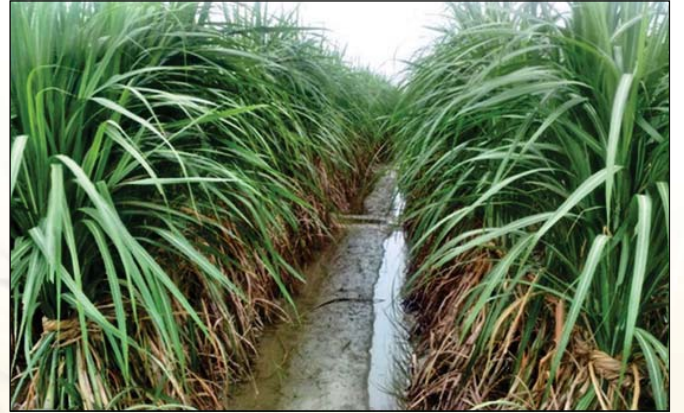
Field view of state varietal trial Wheat and Sugarcane