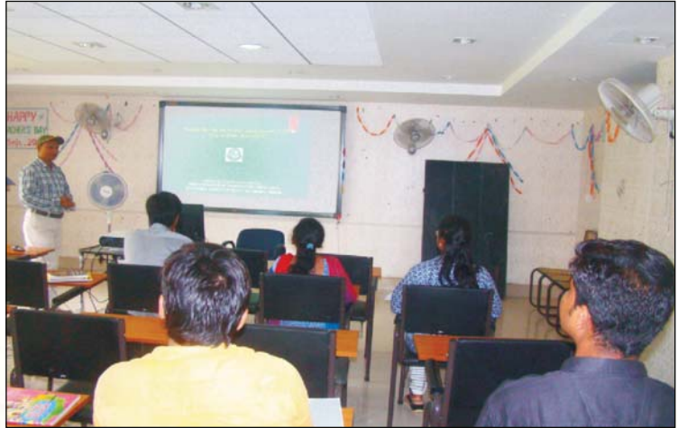
Smart Class Room

विश्वविद्यालय प्रक्षेत्र में भूमि के अन्दर पाईप लाईन से सिंचाई की व्यवस्था का कार्य प्रगति पर है। इस सुविधा के द्वारा जहाँ सिंचाई की गुणवत्ता को एक तरफ सुरक्षित किया जा सकता है, वहीं समय पर सिंचाई व्यवस्था उपलब्ध कराई जा सकती है। विश्वविद्यालय प्रक्षेत्र के कुछ ट्यूबवेल्स को सौर पंपिंग प्रणाली के साथ जोड़ा गया है जो आर्थिक बचत के साथ किसानों को ग्रीन ऊर्जा प्रयोग के प्रति जागरूक करता है।