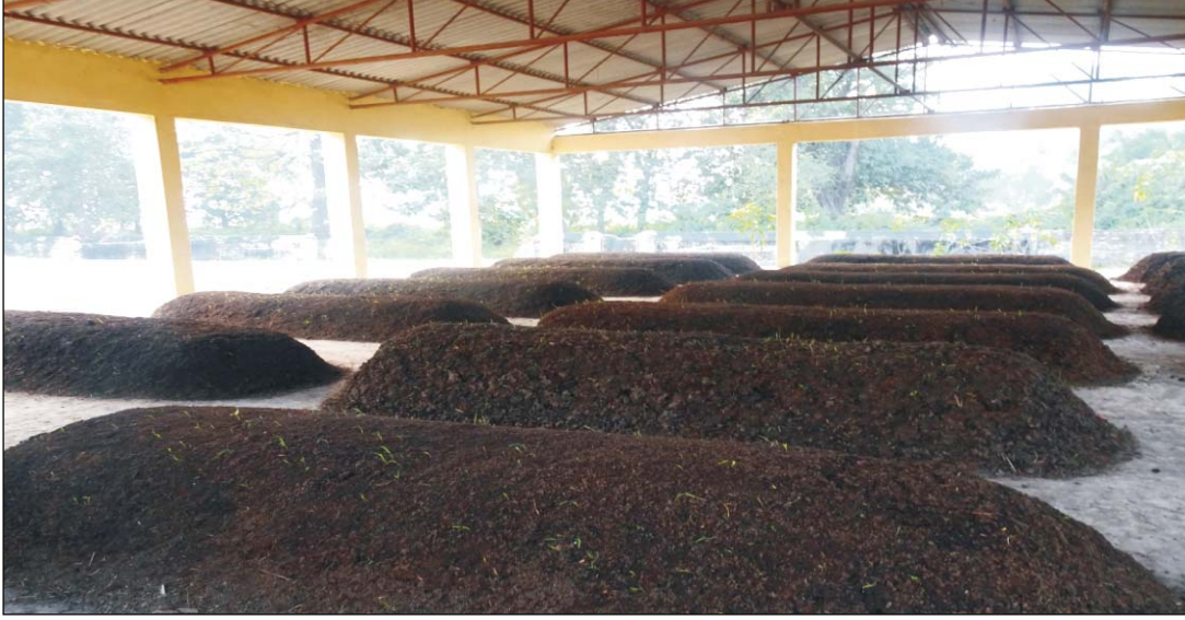
Recycling of household waste