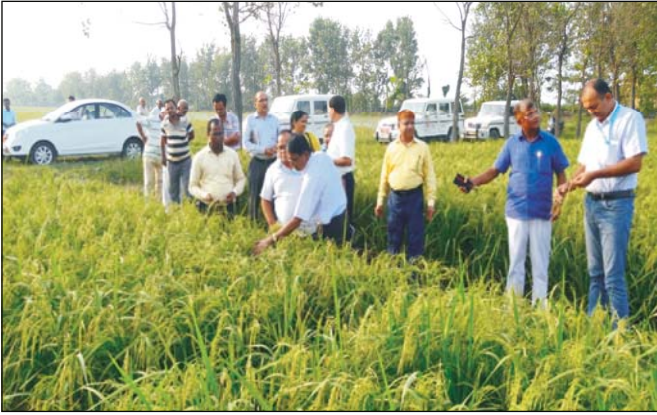
Fig.: Field Visit of variety release committee

फसल प्रजातियाँ जैसे राजेन्द्र गन्ना-1, राजेन्द्र अरहर-1, राजेन्द्र गेहूँ-1, राजेन्द्र नीलम-1, फौक्स टेल (राजेन्द्र कौनी), धनियाँ (राजेन्द्र धनिया-1) विकसित किए गए जिसे जारी करने हेतु विश्वविद्यालय की अनुसंधान परिषद की बैठक में अनुशंसित किया गया है।