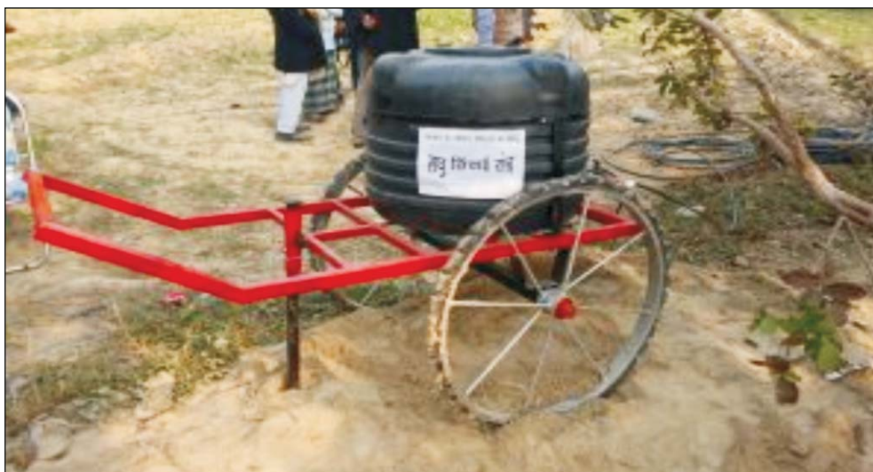
Laghu Sinchai Yantra

किसान मेला, स्थानीय समाचार पत्रों में प्रकाशन, आकाशवाणी एवं दूरदर्शन वार्तालाप, मोबाईल एप्प पर आधारित सलाहकार सेवा इत्यादि कार्यक्रम संचालित किए जाते हैं।