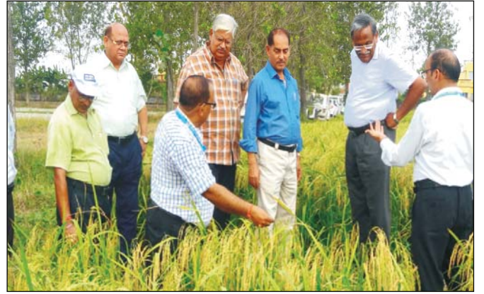
Fig.: Field Visit of Hon'ble Vice-Chancellor